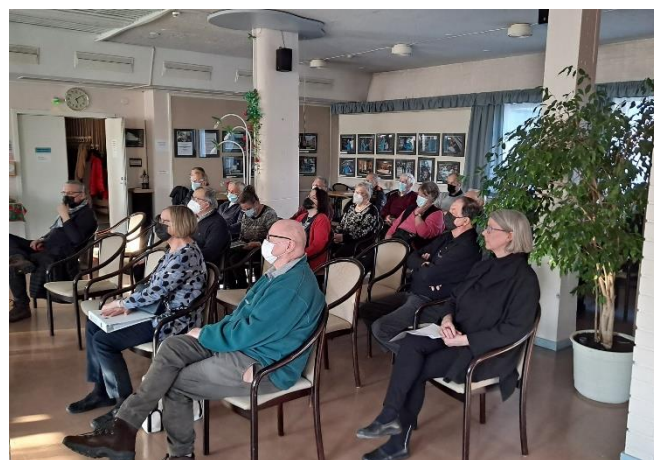
Jätehuoltoa kuulemassa Hyvinvointikeskuksella.

Keravalla ekopisteet, joissa on kaikki pakkausjätteet sekä pienmetalli, sijaitsevat Kanniston pientaloalueella, Kurkelassa, Ahjossa, Saviolla ja Kerava-Tuusula rajalla K-Market Parila. Kiertokapula kerää vaarallisia jätteitä Keravalla tiistaisin klo 16:25 vanhalla torilla sekä pari kertaa vuodessa keräystempauksissaan. Tarkemmin: www.keravanomakoti.fi/uutiset .